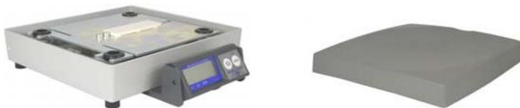
Рис. 2 Общий вид весов МР30 со снятой грузоприёмной чашей